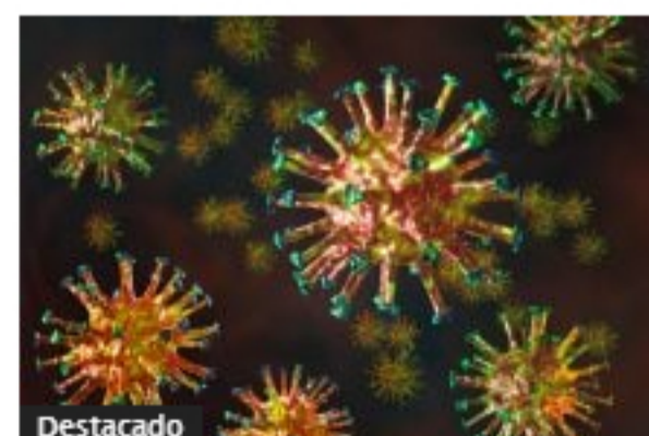
Colombia: hoy se reportaron más de 28 mil casos por Covid-19