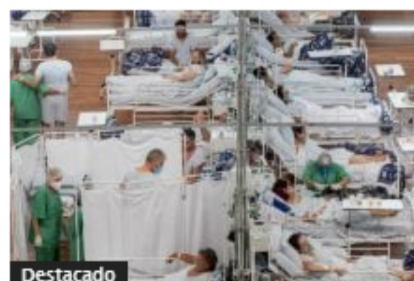
Brasil supera las 500.000 muertes por Covid-19