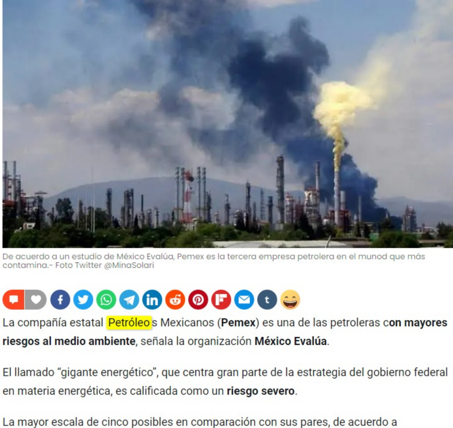
De acuerdo a un estudio de México Evalúa, Pemex es la tercera empresa petrolera en el mundo que más contamina.

La compañía estatal Petróleos Mexicanos (Pemex) es una de las petroleras con mayores riesgos al medio ambiente, señala la organización México Evalúa.