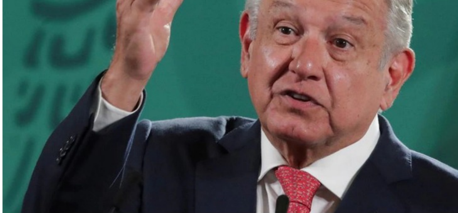
El presidente Andrés Manuel López Obrador es criticado por impulsar la construcción de refinerías y relegar los paneles solares y parques eólicos .

En abril de 2021, el dato más reciente reportado por el Centro Nacional de Control de Energía (Cenace), las termoeléctricas –que también ocupan diésel o gas, pero en su mayoría combustóleo– produjeron 1.6 megawatts-hora. Una cifra más alta a la vista en el mismo mes de 2020, pero que aún marca una tendencia que se mantiene a la baja.