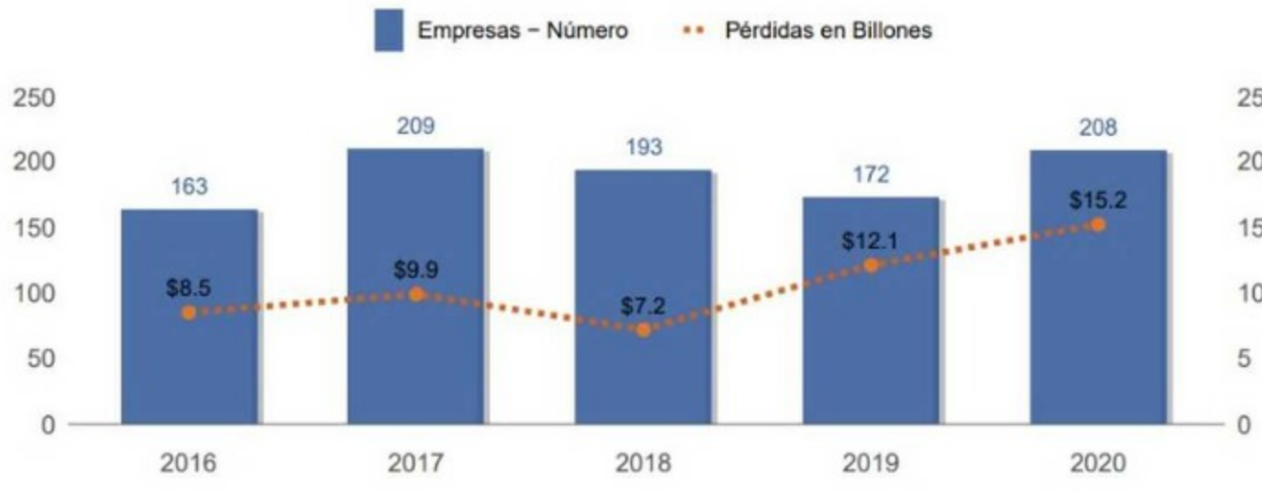
Empresas con pérdidas.

Por otra parte, Bogotá sigue siendo la región del país con la mayor cantidad de empresas dentro de este grupo de las 1.000 más grandes, a pesar de que incluyó 7 menos en el listado. Según el informe, en la capital del país están 528 compañías del total , seguido de Antioquia, con 183; costa Atlántica, con 126; costa Atlántica, con 82; Centro Oriente, con 43; Eje Cafetero, con 31, y otros, con 7.