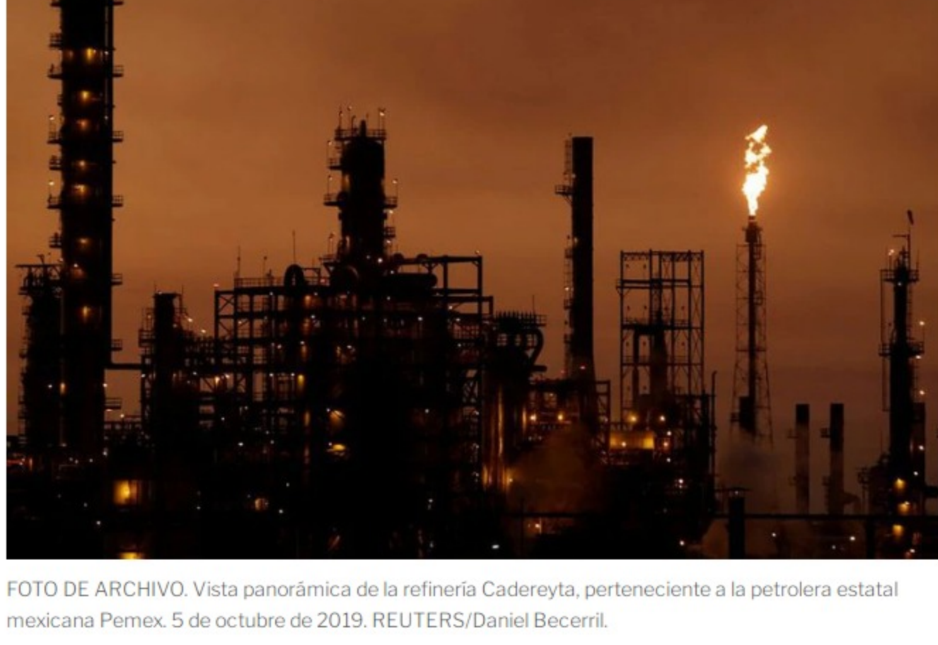
FOTO DE ARCHIVO. Vista panorámica de la refinería Cadereyta, perteneciente a la petrolera estatal mexicana Pemex. 5 de octubre de 2019. REUTERS/Daniel Becerril.

La compañía estatal Petróleos Mexicanos (Pemex) es una de las petroleras con mayores riesgos al medio ambiente , señala la organización México Evalúa . El llamado "gigante energético", que centra gran parte de la estrategia del gobierno federal en materia energética, ha sido calificada como un riesgo severo –la mayor escala de cinco posibles– en comparación con sus pares, de acuerdo a una evaluación que toma en cuenta los indicadores ESG de sostenibilidad (medioambiental, social y gobernanza).