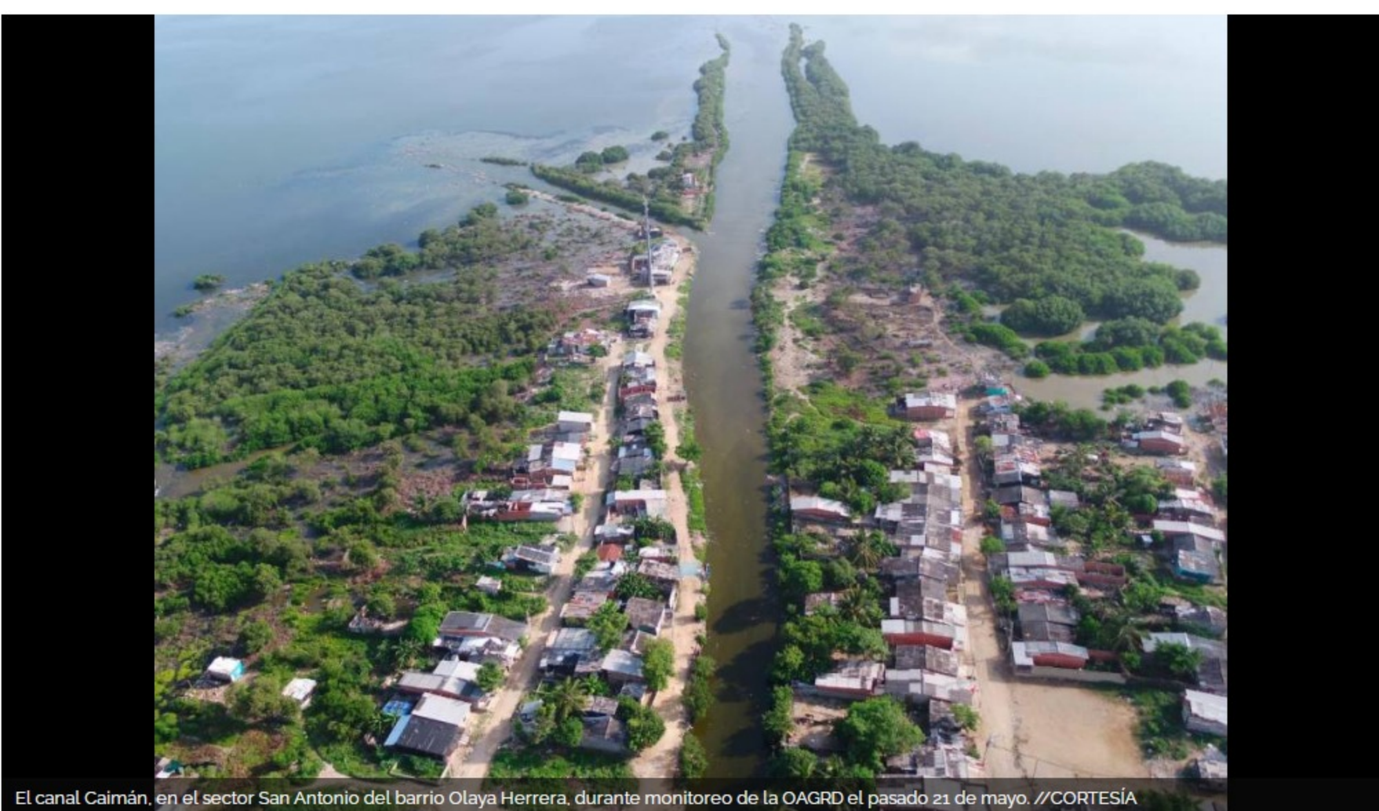
El canal Caimán, en el sector San Antonio del barrio Olaya Herrera, durante monitoreo de la OAGRД el pasado 21 de mayo.

Conozca las condiciones meteorológicas que tendrá Cartagena en los próximos días y cómo Gestión del Riesgo de Desastres trabaja la prevención en barrios vulnerables.