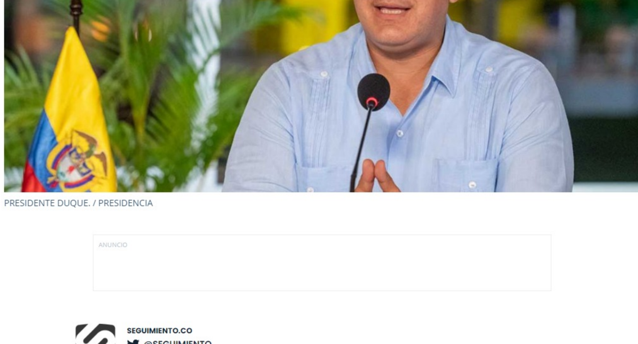
PRESIDENTE DUQUE.