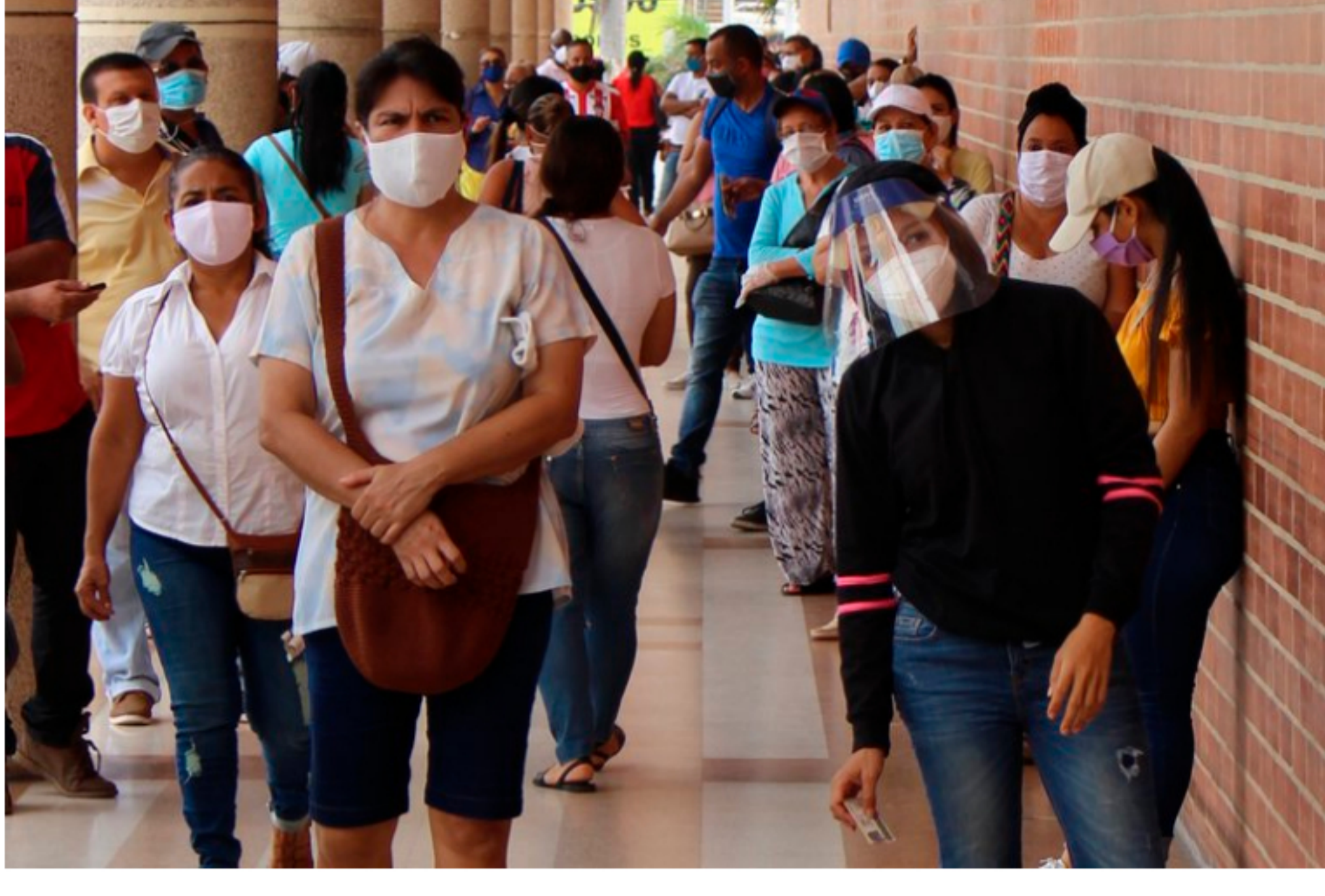
Vista de unas personas aglomeradas en Barranquilla (Colombia)

En el Ranking PAR, indicador que mide la equidad de género dentro de las compañías, evaluó a 300 empresas privadas en Colombia y determinó cuáles tienen mejores indicadores de paridad que permiten cerrar brechas históricas entre hombres y mujeres.