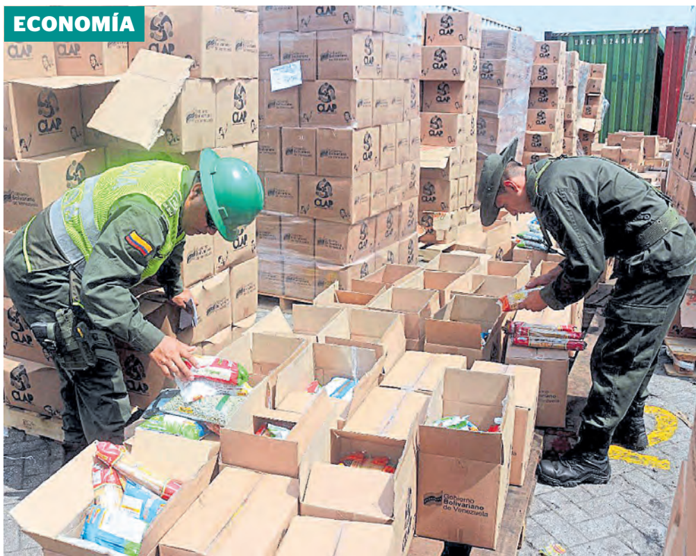
En lo corrido es este año, hasta el 21 de febrero, se han ejecutado 6.789 aprehensiones. CEET

En enero el monto de esos recursos subió 10% frente al mismo mes del 2020, después de registrar cifras positivas el pasado año. Pág. 10