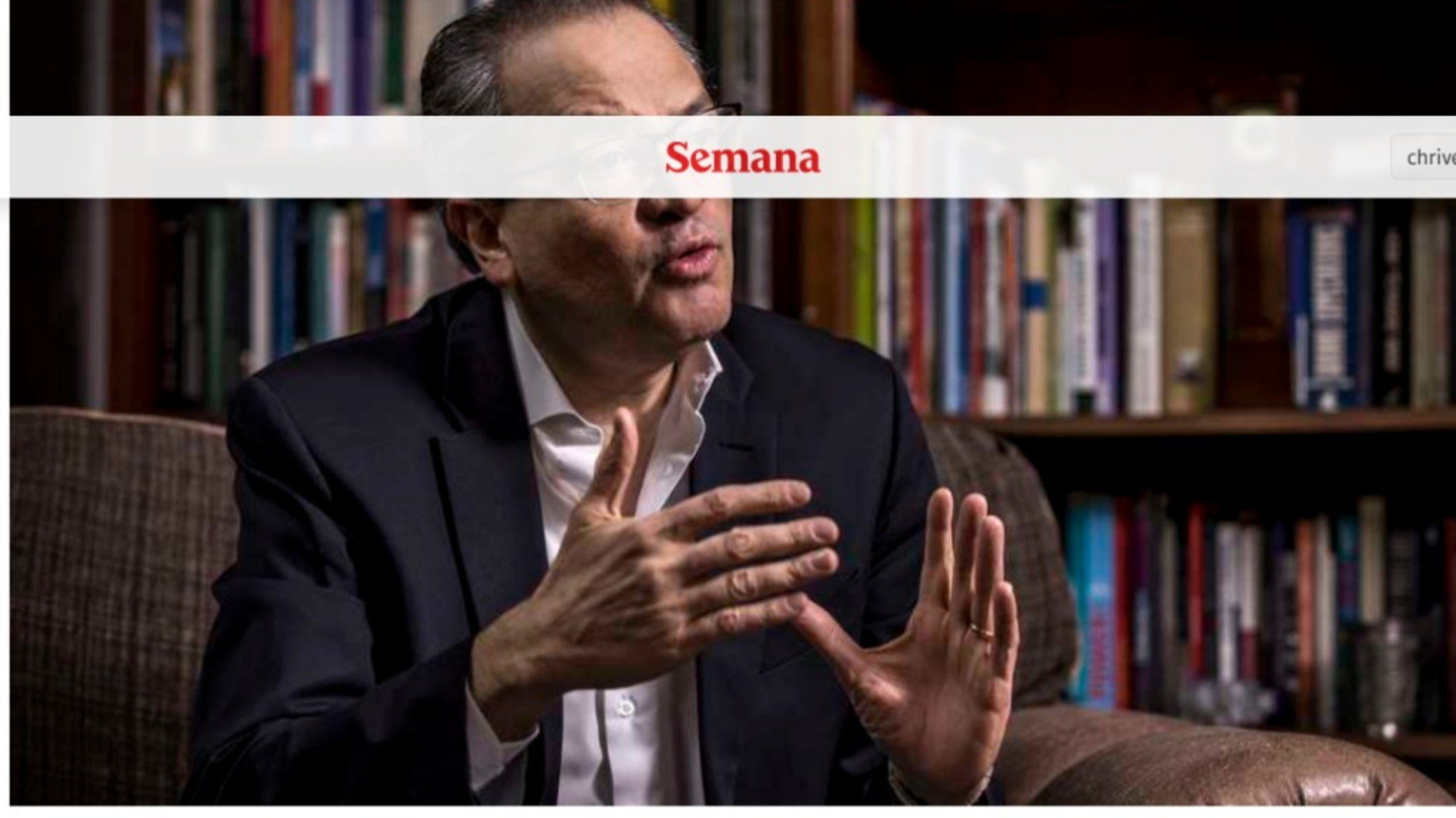
Fernando Carrillo Flórez. Procurador General de la Nación. Bogotá Julio 8 de 2020.

SEMANA conversó con el exprocurador Fernando Carrillo, sobre los 30 años de la Constitución Política de 1991, y otros casos importantes en materia judicial en Colombia. Carrillo, quien fue parte de la Séptima Papeleta que dio origen a la nueva Carta Política, lanza hoy su libro sobre los 30 años de esta, cuyo lanzamiento será a través las redes sociales de la editorial Planeta .