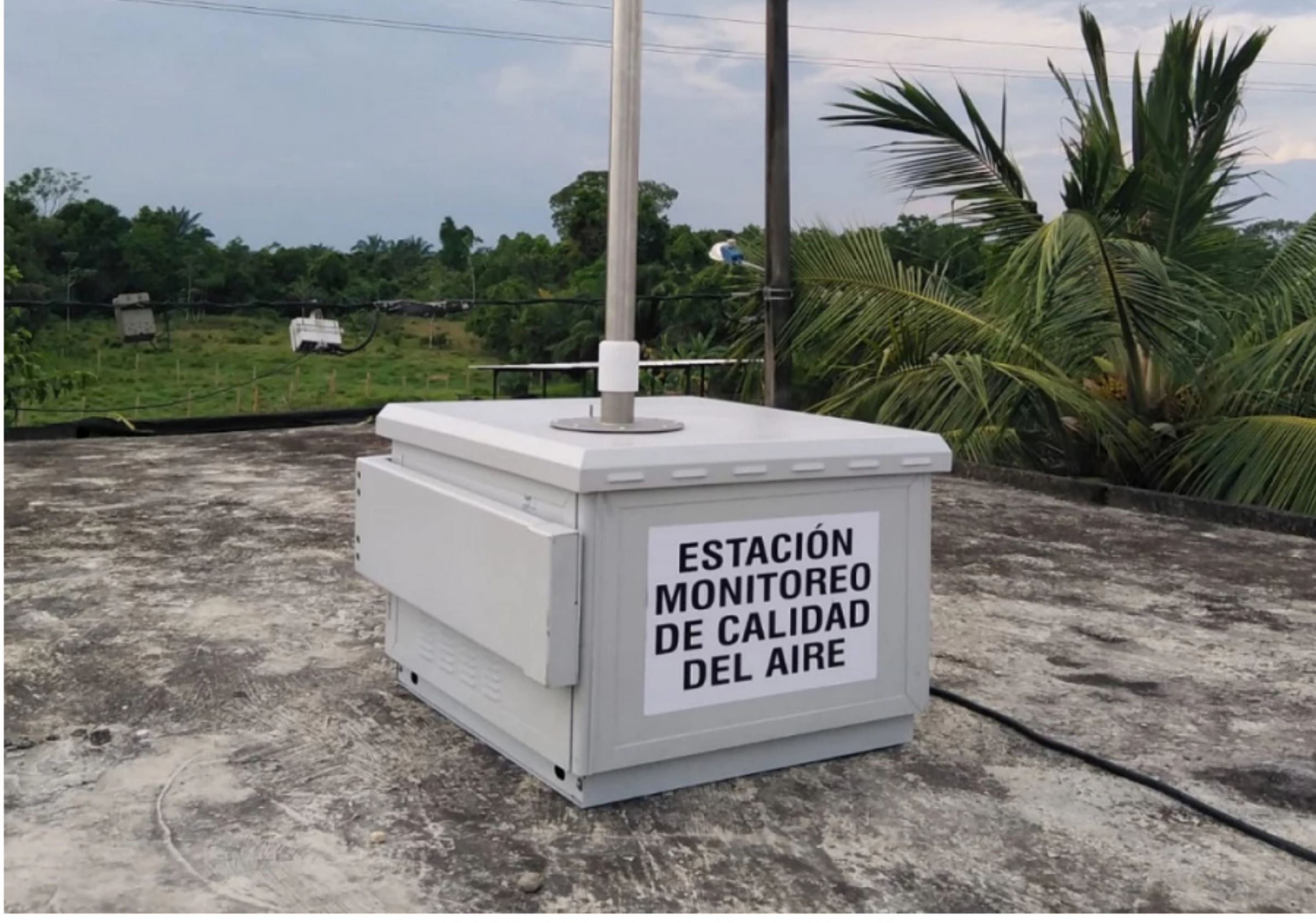
BLU Radio. Estación monitoreo fracking

Tres estaciones medirán las condiciones del aire durante tres meses, antes de iniciar la intervención.