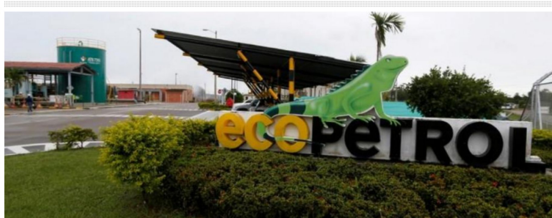
entre US$ 4.000 millones a US$ 5.000 millones por año

La estatal de crudo colombiana ya había anunciado el martes que invertirá US$ 15.000 millones entre este año y 2023 para aumentar su competitividad y asegurar su transición energética. El primer desembolso sería el próximo mes de diciembre, por una cifra que rondaría entre los US$ 3.500 a US$ 4.000 millones.