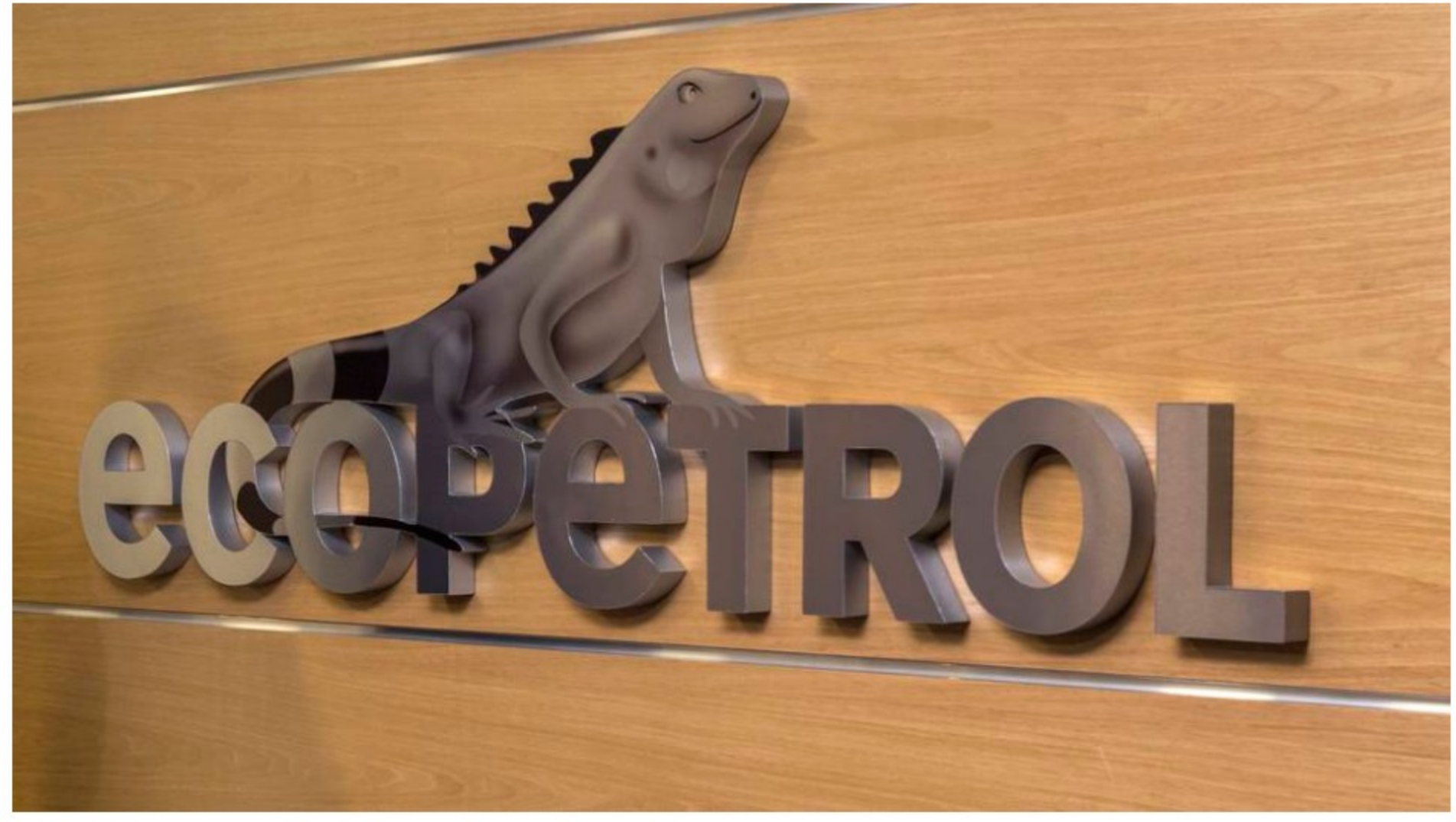
Privados se quedarán con el 20 % de Ecopetrol en negocio de compra de ISA

El que podría ser el negocio de los últimos años en Colombia, la compra de ISA por parte de Ecopetrol , traería consigo un sacrificio para el Estado y es la privatización de una parte de la petrolera.