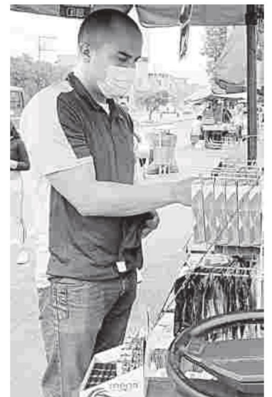
Las restricciones frenaron la dinámica positiva que llevaba el gasto.

Ahora bien, con la foto de cómo cerró el 2020 para la industria y el comercio, el reto es volver a los niveles previos a la pandemia, como lo han alertado varios expertos. "La reactivación tiene que ser un compromiso de todos. Seguramente necesitamos políticas adicionales para volver a la senda que teníamos. Lo importante es que los colombianos nos unamos y logremos recuperar la actividad económica que le permite al país luchar contra la pobreza y la inequidad", concluyó Mac Master.