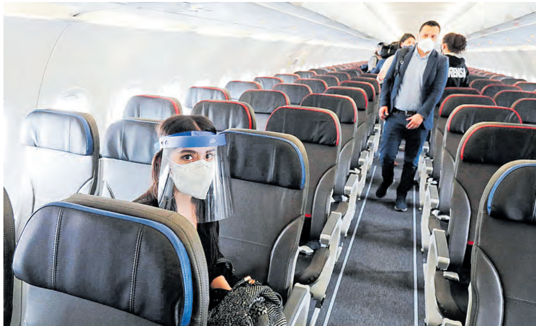
Las siete sanciones de la Supertransporte suman 1.409 millones de pesos.

Entre 2020 y 2021 la Supertransporte ha sancionado a siete empresas aéreas que operan en el país, mientras que ante la SIC se radicaron 2.185 demandas. Los reclamos más comunes se relacionan con cambios de itinerario, reembolsos y problemas con equipaje. Pág. 4