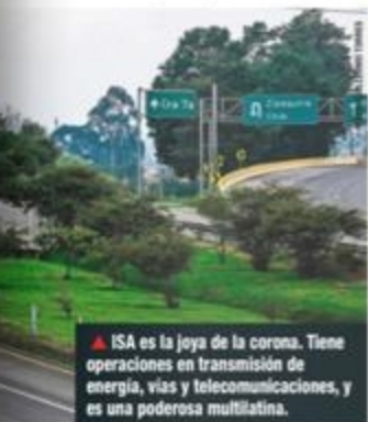
▲ ISA es la joya de la corona. Tiene operaciones en transmisión de energía, vías y telecomunicaciones, y es una poderosa multinacional.

La movida no ha convencido a muchos analistas. Según Bloomberg , la oferta de Ecopetrol para adquirir 51,4 por ciento de ISA "es un movimiento cuestionable y de regreso a la era de las empresas energéticas nacionales integradas y burocráticas". Agrega que la movida es costosa y no genera sinergias operativas. "Es cualquier cosa menos una estrategia para energía descentralizada". JP Morgan considera que la capitalización de la petrolera no es suficiente y tendrá que aumentar su deuda y apalancamiento. La controversia apenas empieza. ■