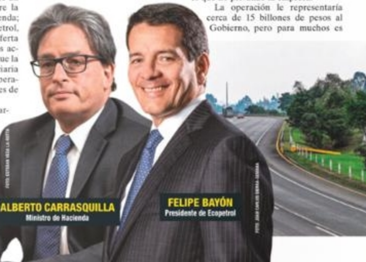
ALBERTO CARRASQUILLA Ministro de Hacienda

La operación le representaría cerca de 15 billones de pesos al Gobierno, pero para muchos es