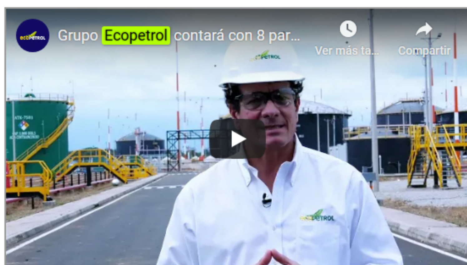
Video. Grupo Ecopetrol contará con 8 parques solares en 2021.

El presidente de Ecopetrol , Felipe Bayón dijo que "Los nuevos parques solares significan un gran avance en nuestro plan de transición energética, el cual contempla contar con una capacidad instalada de energías renovables de alrededor de 400 MW al año 2023. Nuestro objetivo es impulsar un futuro energético sostenible y confiable para Colombia, y aportar a la meta del Gobierno Nacional de reducir el 51% de las emisiones de gases de efecto invernadero en el país al año 2030".