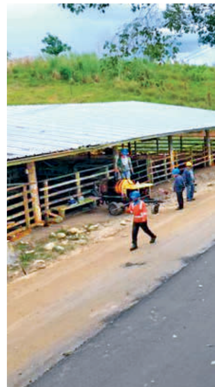
Construcción de la carretera que va

Por ejemplo, en uno de los proyectos de Celsia se entregaron 487 computadores a 8 instituciones educativas con 100 sedes del área urbana y rural de Planadas (Tolima), con una inversión de $2.725 millones.