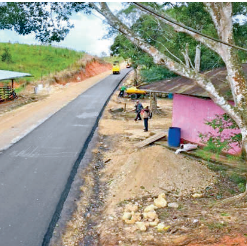
de El Paujil a Cartagena del Chairá (Caquetá).