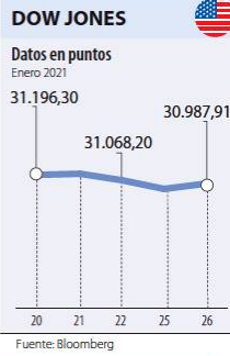
Fuente: Bloomberg / Cifras en dólares