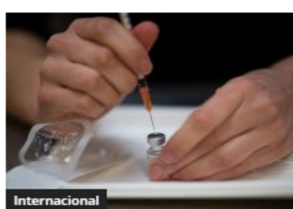
Latinoamérica recibirá 280 millones de vacunas anticovid