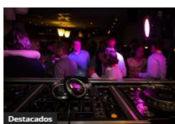
Las fiestas clandestinas: la ruleta rusa del Covid-19