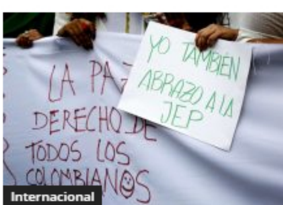
Inicio del 2021 es el más violento desde la firma del acuerdo: JEP