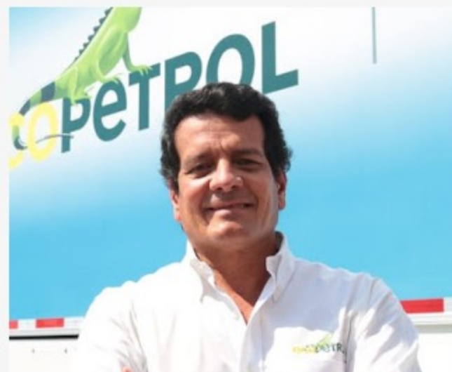
Felipe Bayón Presidente de Ecopetrol

Además de conocer el avance del parque solar San Fernando, el Presidente de la República también inauguró la estación Castilla 3, una moderna locación que apalanca los procesos de recolección y tratamiento de agua y gas en esta zona, la mayor productora de hidrocarburos del país.