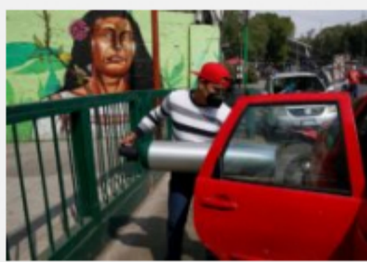
México publica nuevos máximos diarios de casos de pandemias y muertes