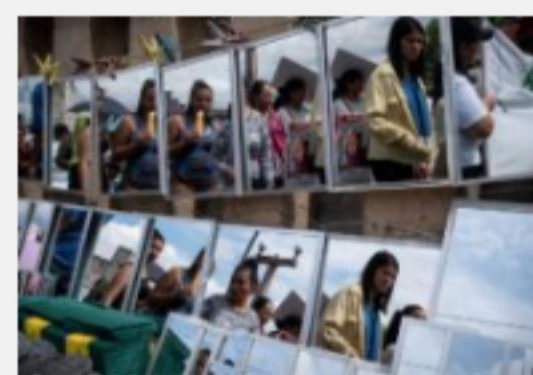
Activistas hondureños por el derecho al aborto prometen seguir luchando tras el revés