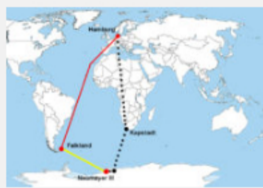
Argentina aclama la solicitud de viaje a las Malvinas alemanas como apoyo para la reivindicación de soberanía