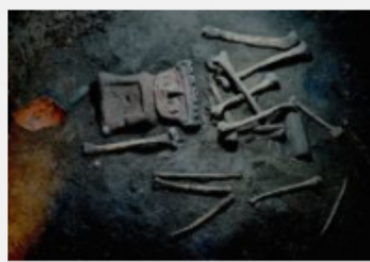
En México, arqueólogos revelan una historia de canibalismo y conquista