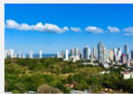
Panamá comienza las vacunas contra el Covid-19