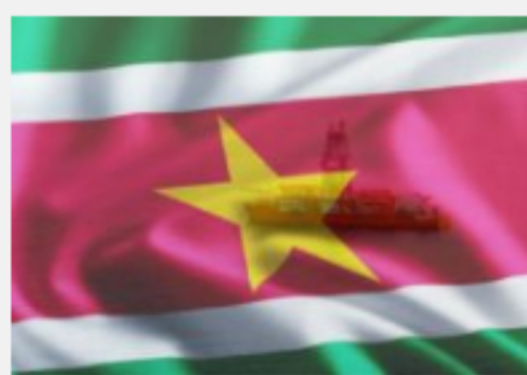
Las grandes petroleras miran el auge de la costa de Surinam