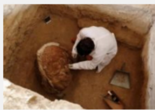
Hijos de nobles incas encontrados enterrados en Perú después de 500 años