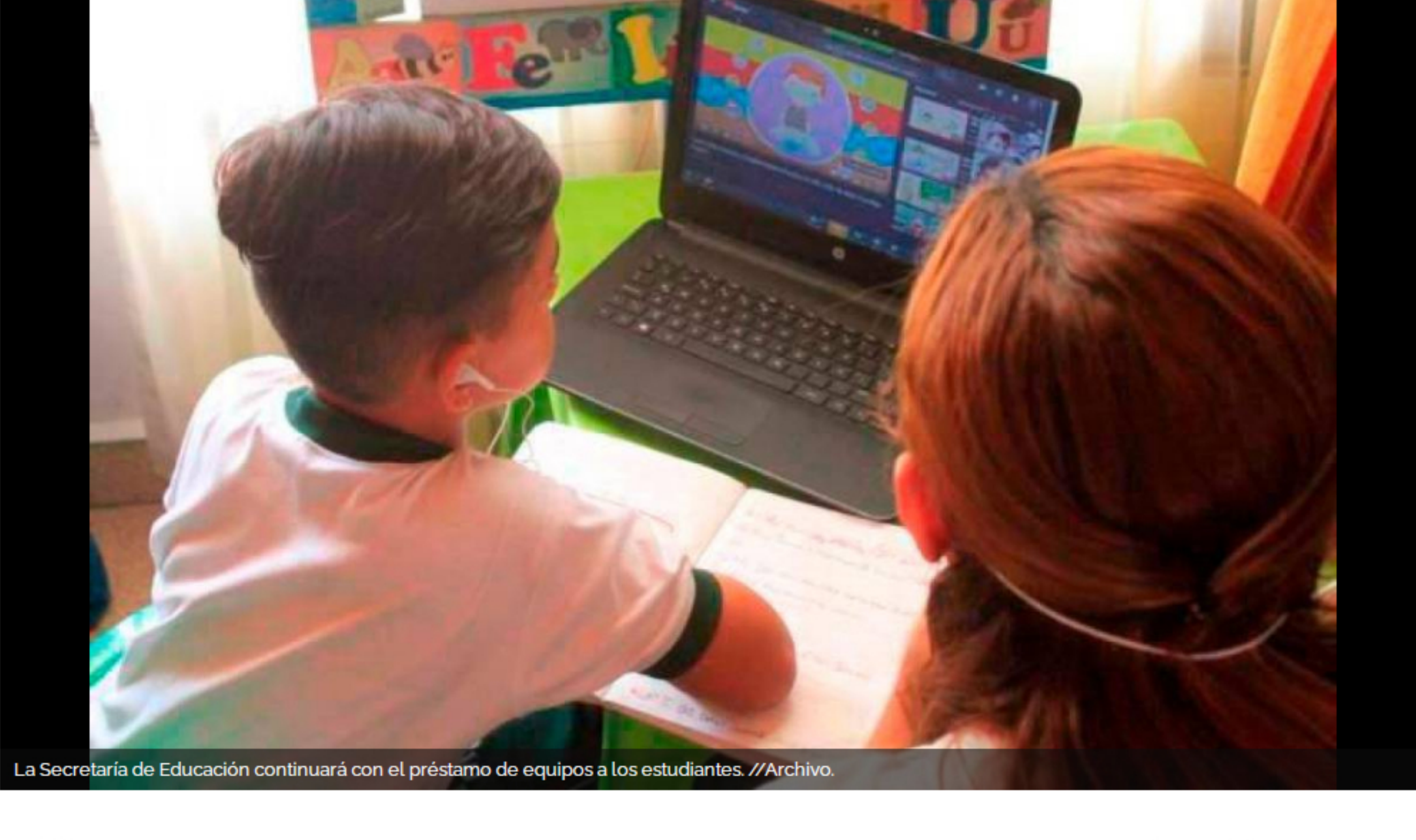
La Secretaría de Educación continuará con el préstamo de equipos a los estudiantes.

Los colegios públicos deberán seguir dando clases virtuales por lo menos durante el comienzo del año escolar.