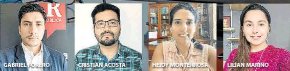
Periodistas de LR que participaron en el Inside LR