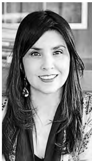
María Victoria Angulo es la actual ministra de Educación.

Ellas figuran en la lista corta que el Gobierno elaboró para seleccionar a quienes ocuparán los cargos que quedarán vacantes en la junta directiva de entidad en el 2021. El Presidente Iván Duque, deberá elegir dos nombres este año. Pág. 6