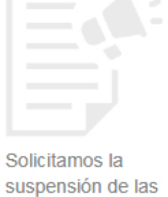
Solicitamos la suspensión de las