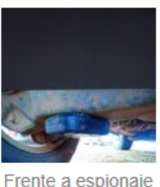
Frente a espionaje de inteligencia