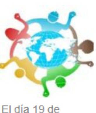
El día 19 de octubre se han