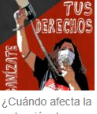
¿Cuándo afecta la reducción de