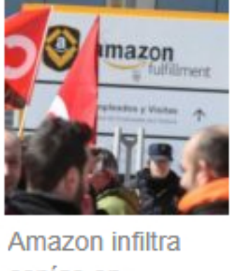
Amazon infiltra espías en