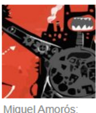
Miquel Amorós: «El enfoque»