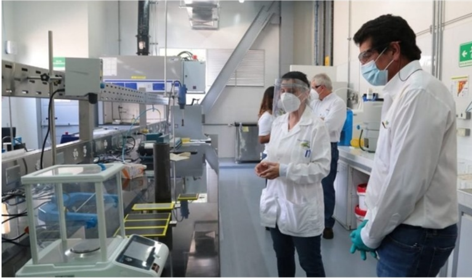
Ecopetrol aseguró que este vehículo tuvo una inversión de mil millones de pesos. . Foto: Suministrada

Ecopetrol aseguró que este vehículo tuvo una inversión de mil millones de pesos.