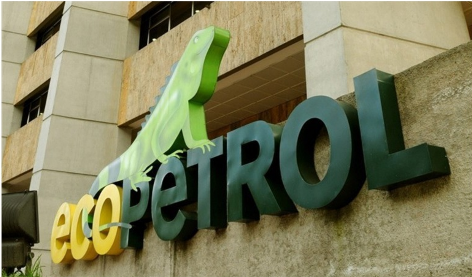
Ecopetrol vendió su participación de la sociedad Offshore International Group.

El 50% del capital social es la participación que vendió la estatal en Offshore International Group.