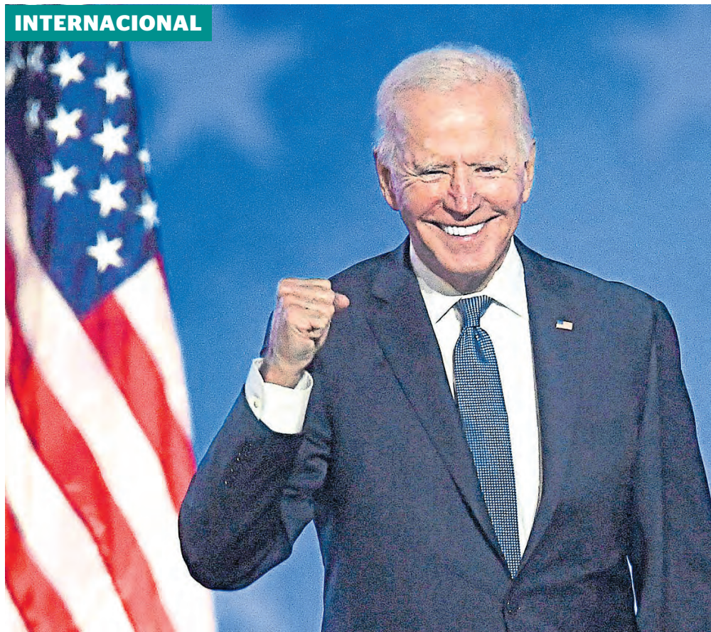
Joe Biden, asume hoy como nuevo presidente de los Estados Unidos.