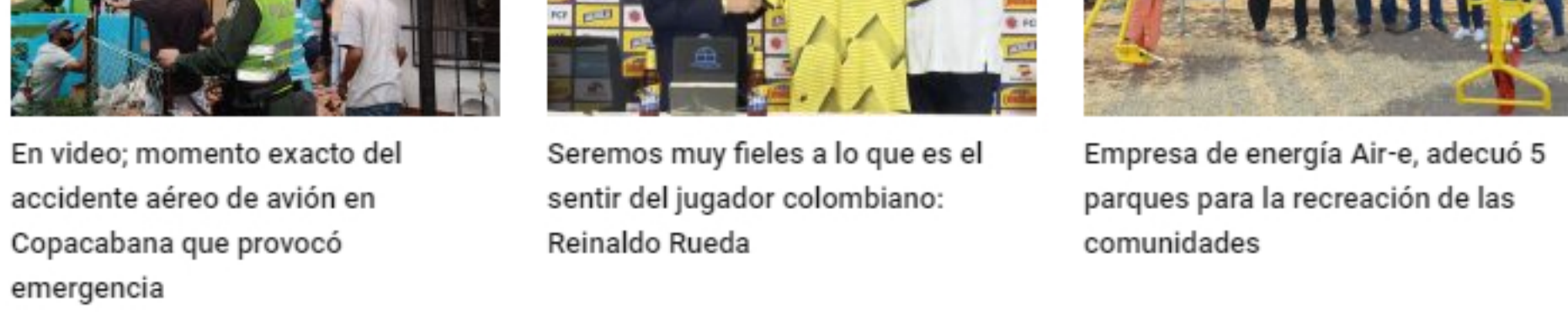
En video; momento exacto del accidente aéreo de avión en Copacabana que provocó emergencia Seremos muy fieles a lo que es el sentir del jugador colombiano: Reinaldo Rueda Empresa de energía Air-e, adecuó 5 parques para la recreación de las comunidades