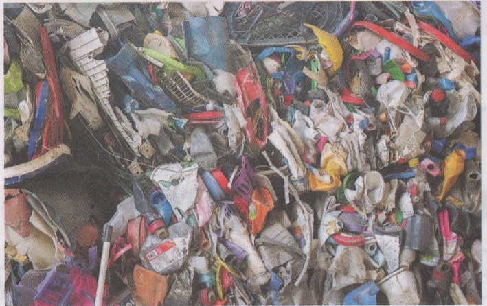
Al mes procesan entre 5 y 10 toneladas de plástico.