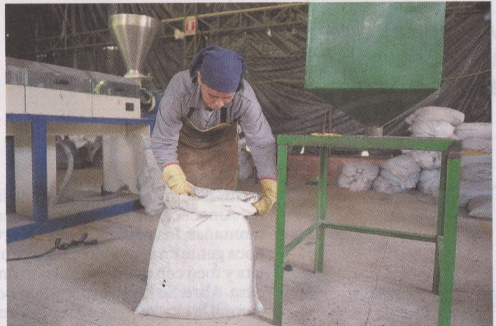
La materia prima la recogen cerca de 40 recicladores.