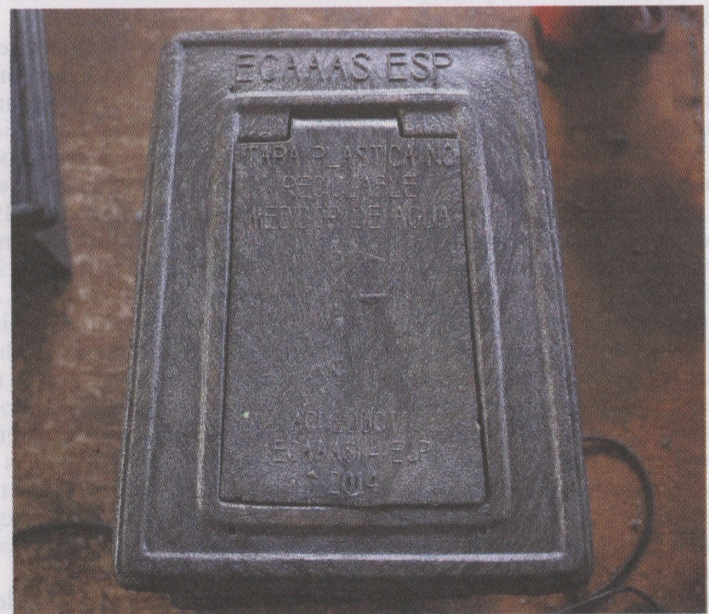
Los contenedores con los medidores de agua se instalan en cada una de las casas de los beneficiarios.

En Ecaas trabajan 130 personas, de las cuales 110 están en la nómina y 20 son temporales.