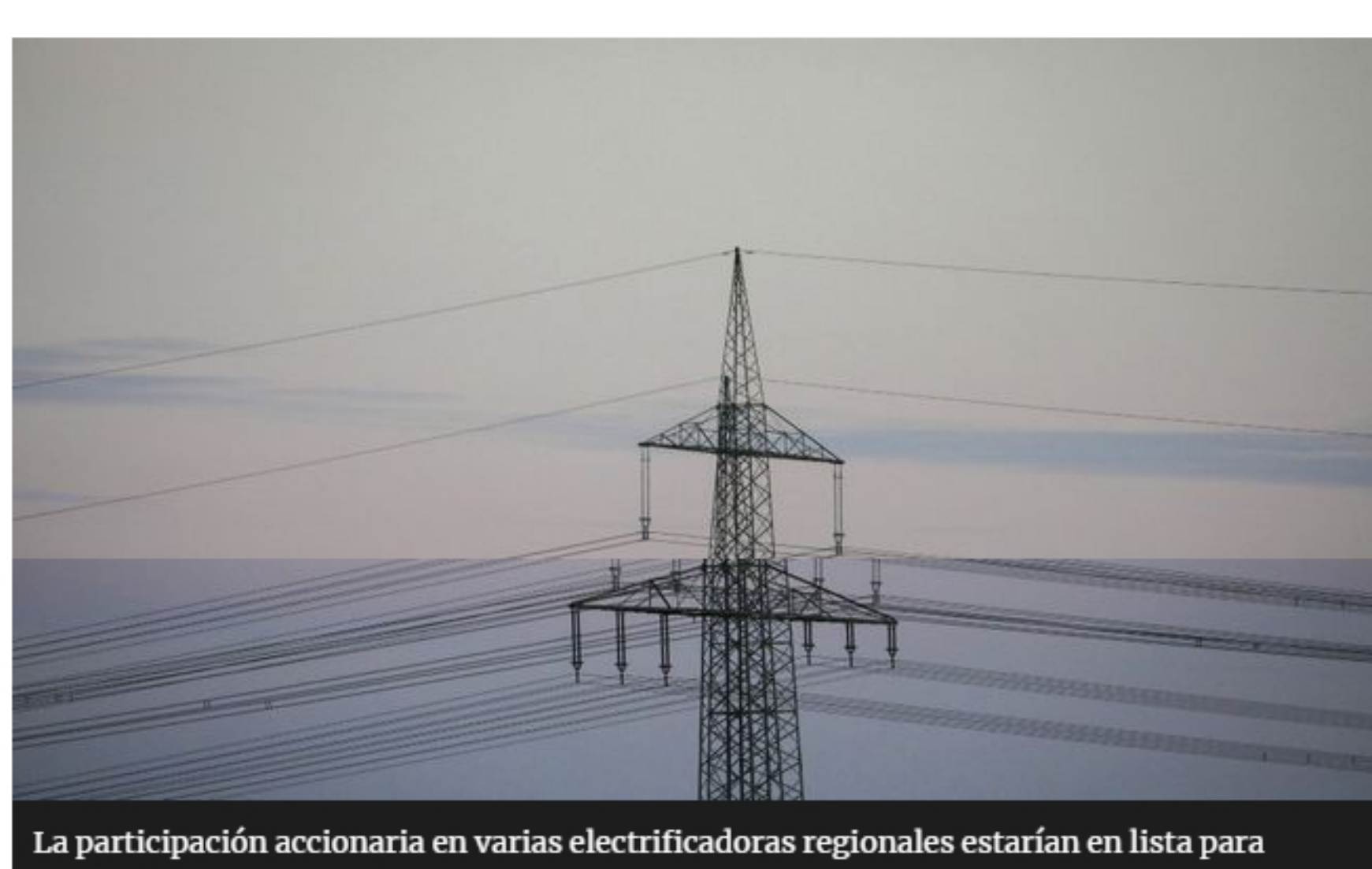
La participación accionaria en varias electrificadoras regionales estarían en lista para vender.