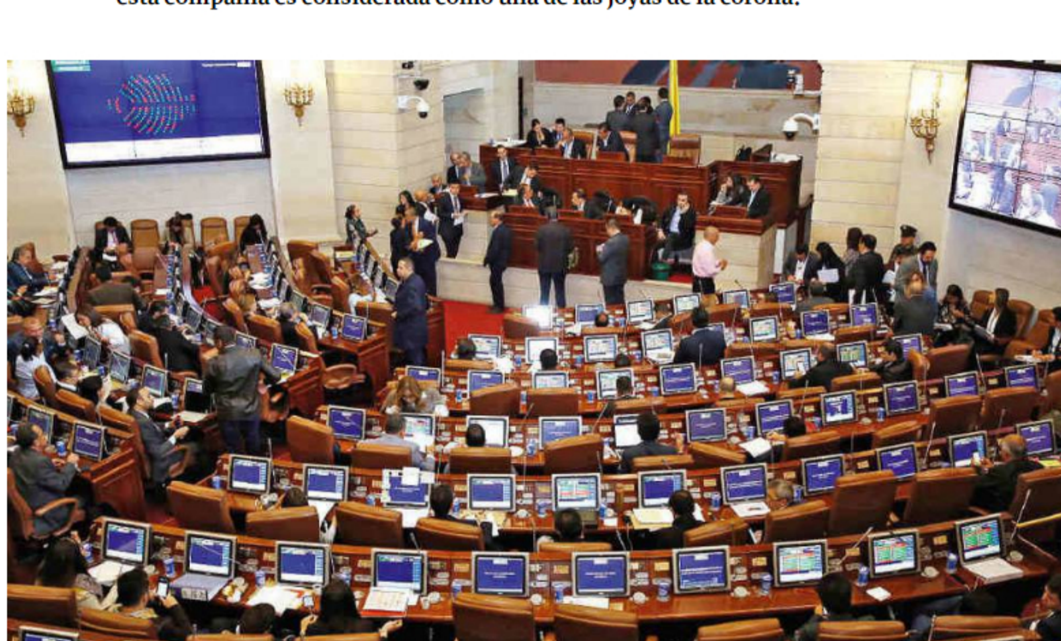
En el Plan de Desarrollo, el Congreso aprobó la venta exprés de empresas en las que la Nación tenga participaciones minoritarias.

La venta de participaciones accionarias del Estado en empresas donde el Estado tenga menos del 50 % está aprobada en el Plan Nacional de Desarrollo (PND). Sin embargo, cada vez que se menciona a ISA, la polémica no se hace esperar, pues esta compañía es considerada como una de las joyas de la corona.