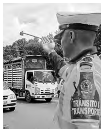
Aumentan controles en las vías.

En el puente de Reyes no habrá limitaciones entre los municipios. Pág. 7