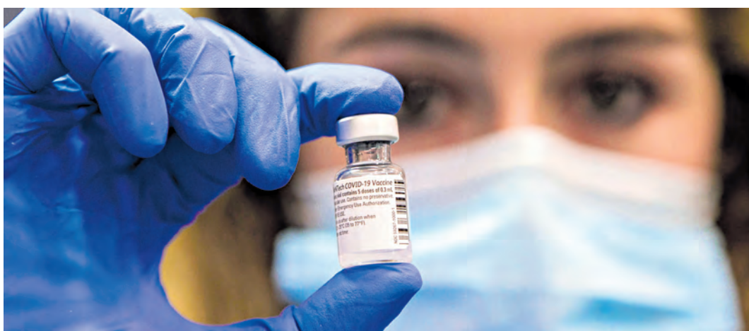
La información de la población vacunada será cargada en la plataforma "Mi Vacuna covid-19".

Este dato no se registraba desde 1954. Los sectores que más pesaron fueron alimentos y servicios. Prendas de vestir y calzado, las que menos aportaron. Pág. 2