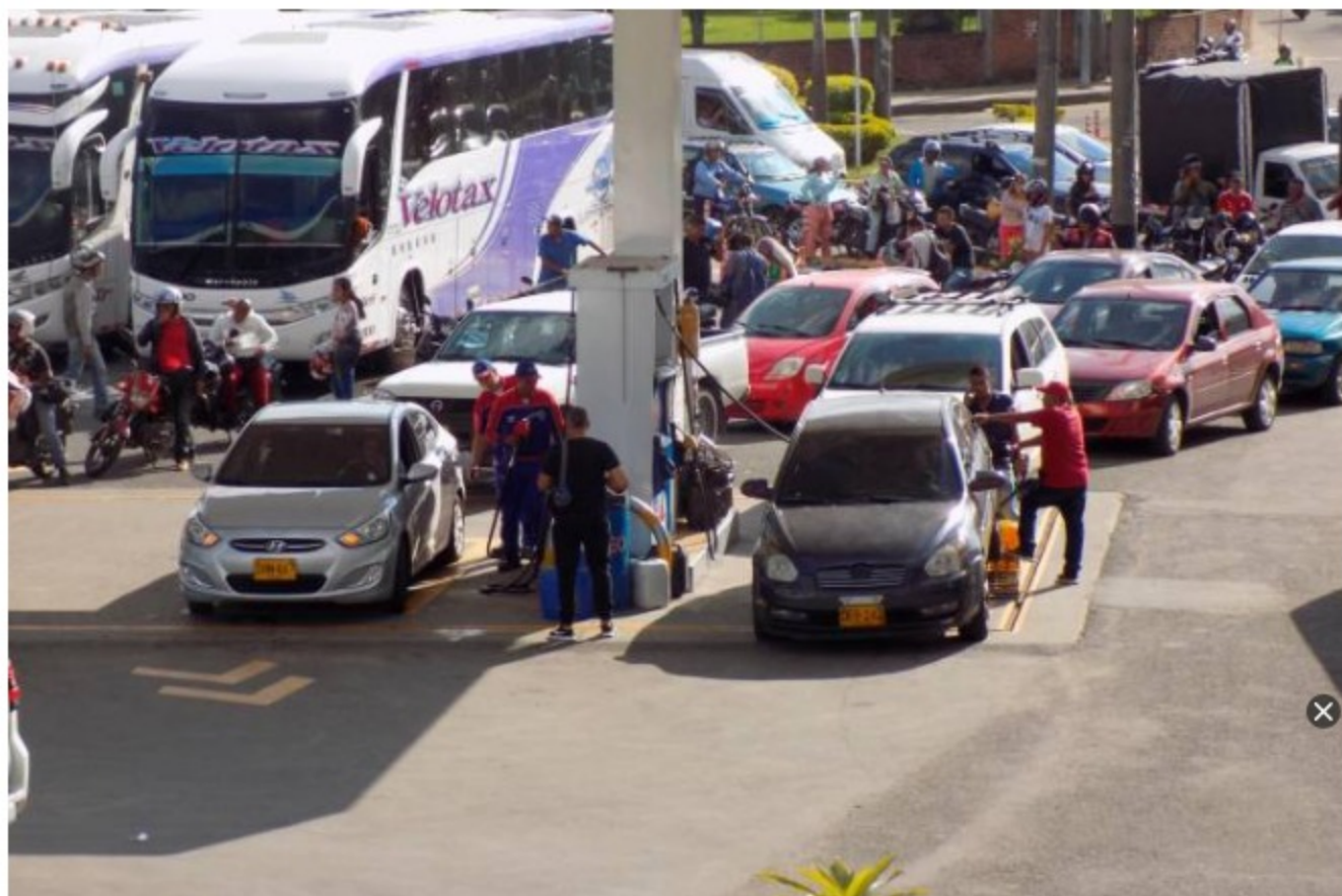
Según Ecopetrol , las ventas de gasolina aprecian un aumento del 25% frente a los niveles reportados en 2019.

La Federación Nacional de Biocombustibles de Colombia anunció que tienen la infraestructura para aumentar producción y garantizar el suministro de combustible que necesita el país para enfrentar la alta demanda de fin de año.