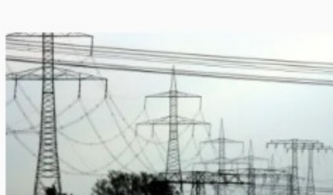
La subasta de radiodifusión debe tener una fuerte competencia, pero los costos pueden reducir los descuentos.

El criterio para las licitaciones fue una mayor oferta de excedentes de petróleo con destino a la Unión, luego de descontar los gastos de producción e inversión. Los porcentajes mínimos de oferta fueron el 5,89% del excedente del campo Atapu y el 15,02% del campo Sépia.