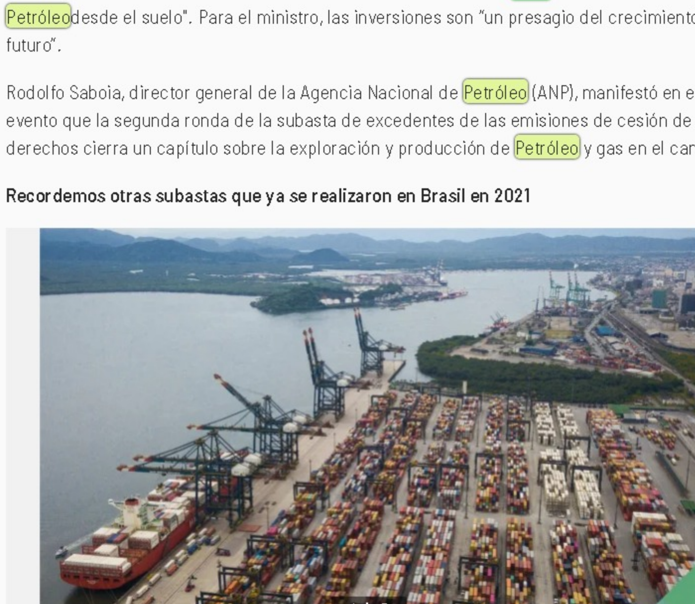
La terminal STS08A, en el Puerto de Santos, fue vendida por R $ 558.250.000,99 por Petrobras, este viernes (19). El área está destinada al movimiento, almacenamiento y distribución de combustibles líquidos a granel.