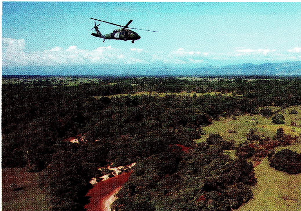
Helicóptero UH-60 acompaña lanzamiento de pellets

es demasiado alto y pudo haberse dirigido a otras estrategias de restauración que han demostrado ser más efectivas y que generarían empleo, inversión y un vínculo con las comunidades de las regiones.