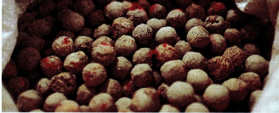
La fabricación de pellets involucró a 25 personas de la comunidad.