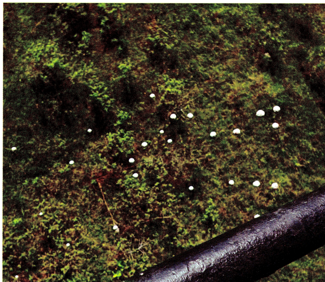
En total se lanzaron 10.000 pellets.