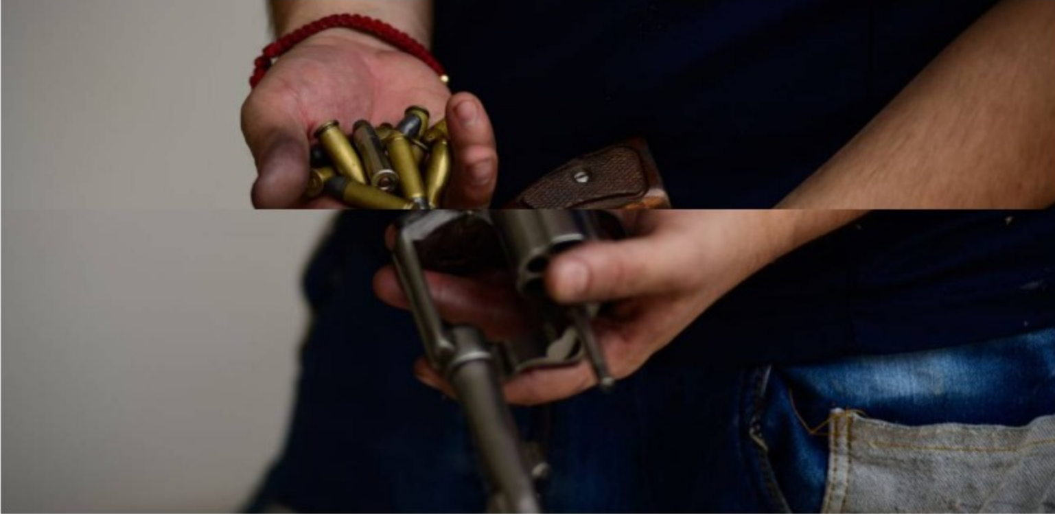
Armas en Colombia / . (Getty)

El país entregó la nueva versión del reporte sobre terrorismo, en el que dice que Colombia sigue siendo víctima de ataques.