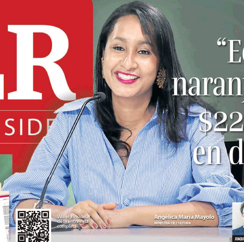
Vea el #InsideLR de la entrevista completa.