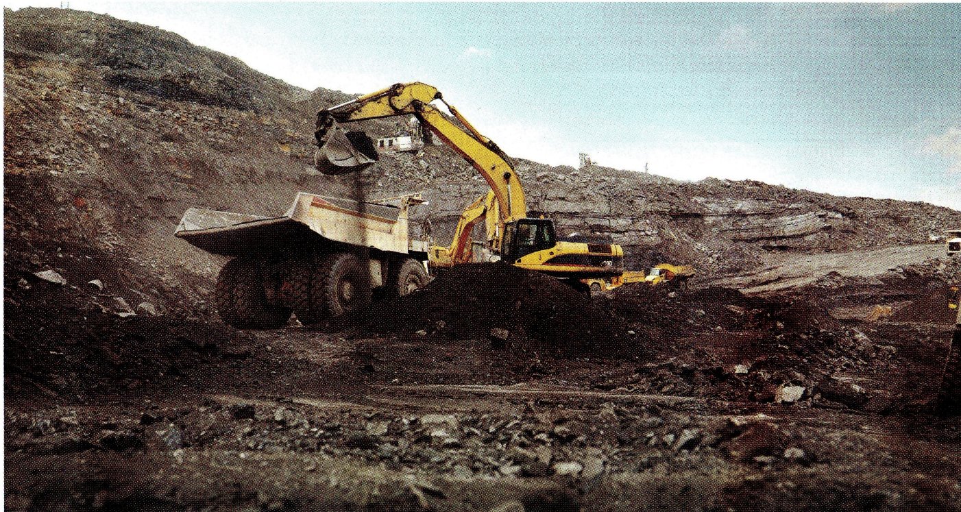
Si bien el sector minero-energético no tiene una gran participación en el PIB, el país es dependiente de las rentas que este genera.