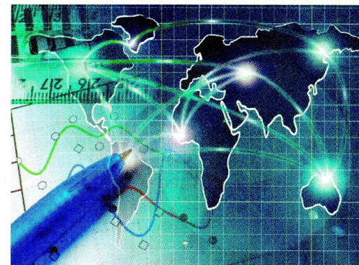
Fortalecimos nuestra ciberseguridad.

Nuestro compromiso será seguirnos adaptando ágilmente, garantizando operaciones seguras, gestionando los procesos de forma eficiente y asegurando ingresos, para fortalecer nuestra solidez y compromiso con las prácticas de sostenibilidad. Así seguimos firmes hacia el futuro.