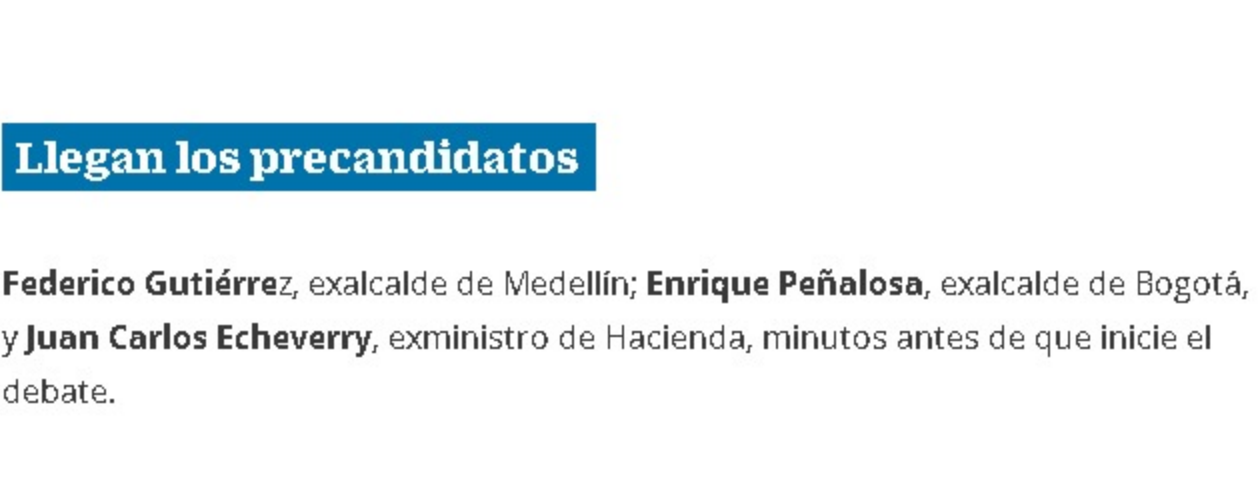
Federico Gutiérrez y Enrique Peñalosa.

Federico Gutiérrez, exalcalde de Medellín; Enrique Peñalosa, exalcalde de Bogotá, y Juan Carlos Echeverry, exministro de Hacienda, minutos antes de que inicie el debate.