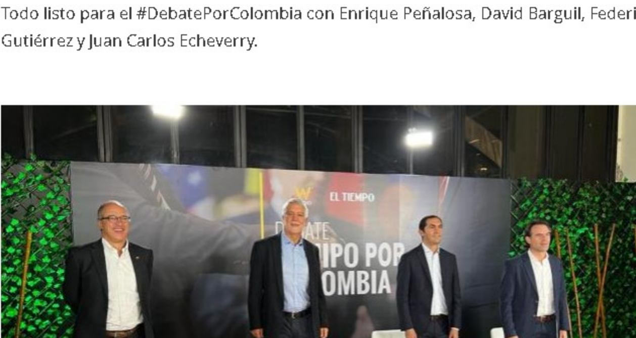
Juan Carlos Echeverry, Enrique Peñalosa, David Barguil y Federico Gutiérrez.

Todo listo para el #DebatePor Colombia con Enrique Peñalosa, David Barguil, Federico Gutiérrez y Juan Carlos Echeverry.