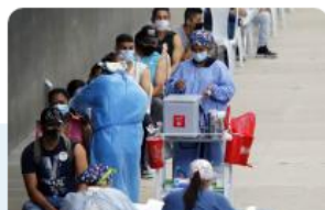
SALUD DEC. 13 DE 2021