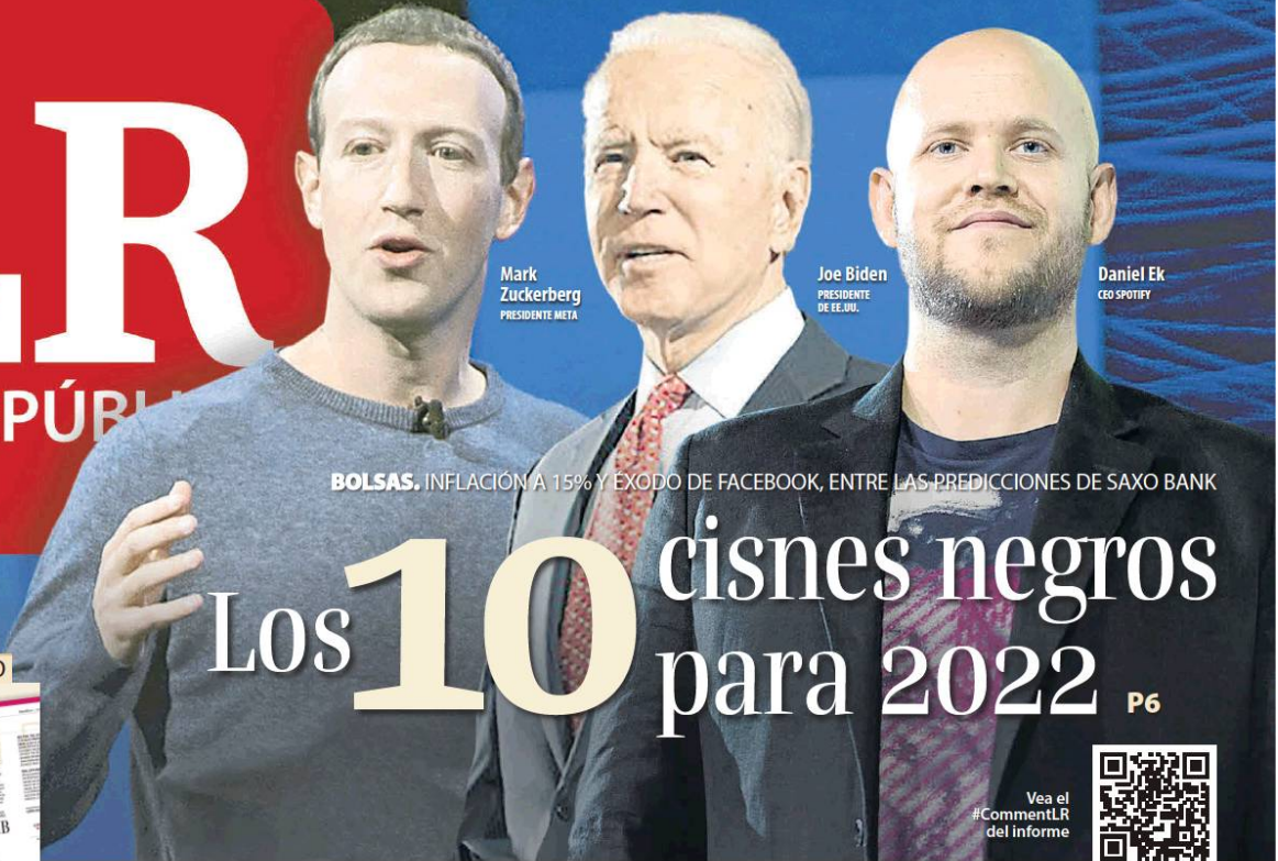
Mark Zuckerberg PRESIDENTE META