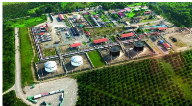
Plan de Inversiones por US$5.800 millones para 2022, anuncia el Grupo Ecopetrol.