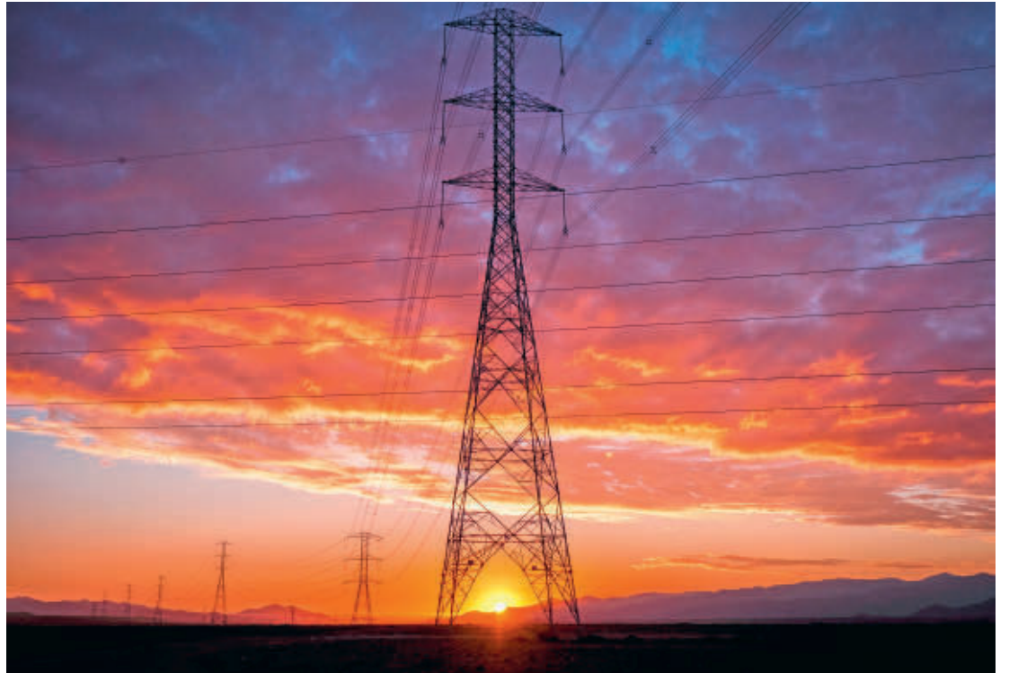
ISA aseguró que el proyecto servirá para conectar los proyectos de energía renovable del norte de Chile, con el centro y sur del país.

Dice ISA que se abre la posibilidad de aumentar la capacidad del Sistema Eléctrico Nacional –de Chile– y evacuar grandes volúmenes de energía renovable “haciendo posible cumplir con el exigente compromiso planteado por Chile, en la COP 26, de poner