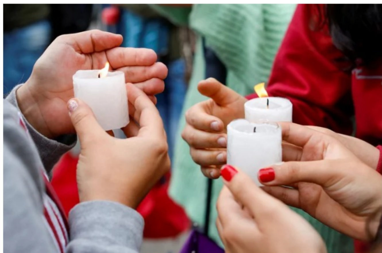
Foto del martes de gente reunida sosteniendo velas y homenajeando al fallecido Dilan Cruz en Bogotá. Nov 26, 2019.

Los productores de vela en la costa Caribe advirtieron este 6 de diciembre que, “no alcanzó la parafina para iluminar la noche de velitas” en esta región de Colombia pues Ecopetrol solo envió 70 toneladas de las 120 que esperaban para la celebración de esta tradición.