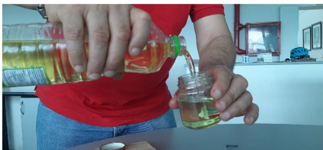
Llene el frasco con el aceite hasta un centímetro por debajo del borde.