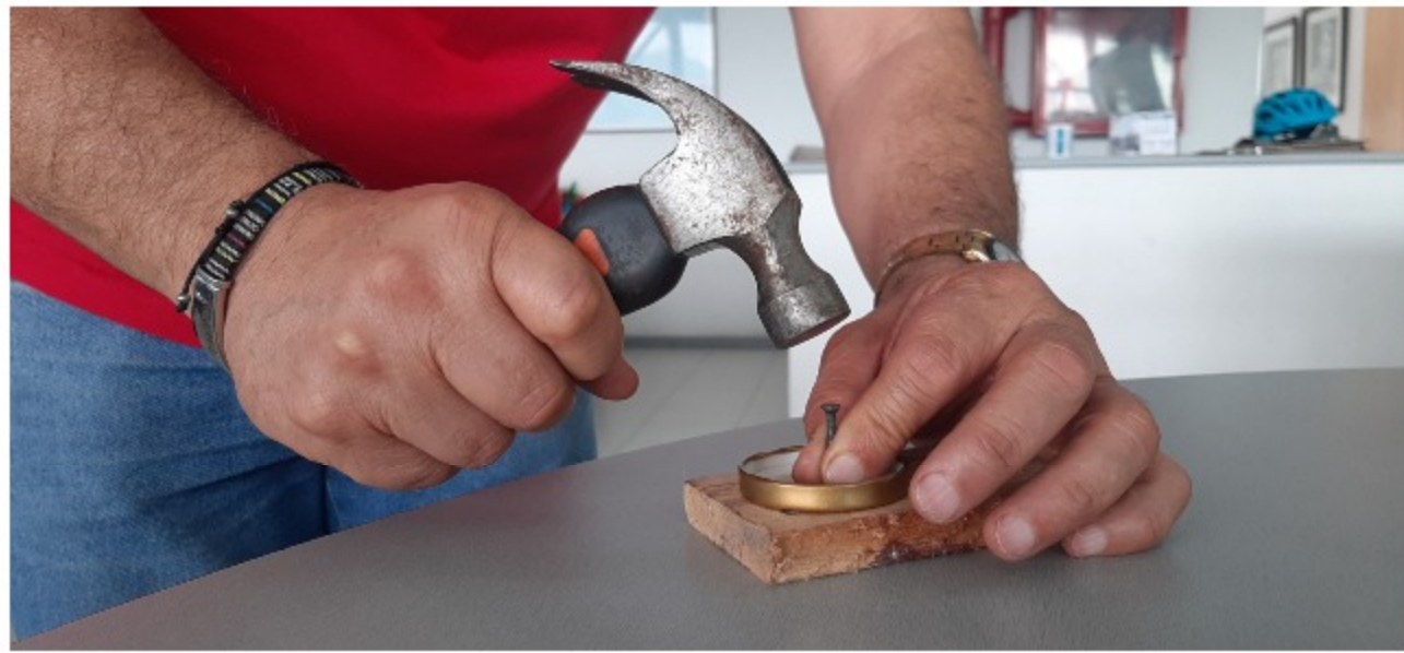
Con el martillo y la puntilla perfora la tapa colocada boca arriba sobre la madera.