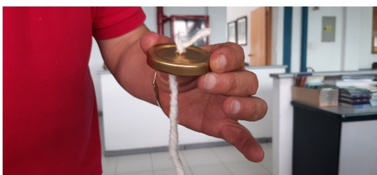
Impregne la mecha con aceite y deje que esta sobre salga un centímetro por encima de la tapa.