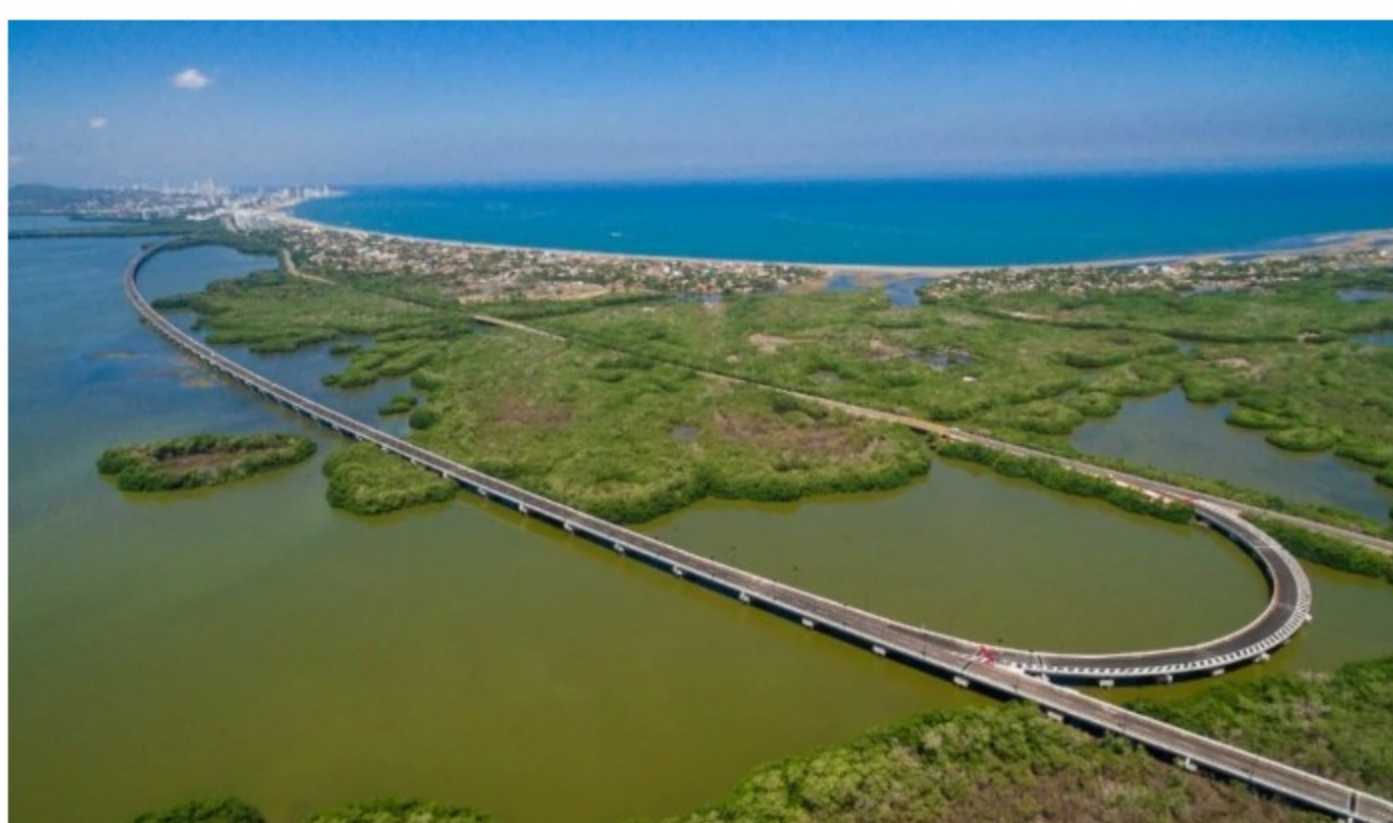
El viaducto sobre la Ciénaga de la Virgen es la obra más emblemática del corredor, sobre todo por sus implicaciones medioambientales.

En estas cifras también están los 36 km que se ejecutaron entre los municipios de Malambo y Galapa, y la zona de Las Flores, en Barranquilla, que permitirán agilizar la movilidad y el acceso hacia la zona portuaria sobre el río Magdalena.