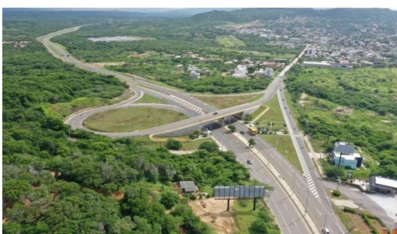
La vía Cartagena - Barranquilla también incluye una conexión entre Barranquilla y Malambo.

En total, el corredor atraviesa los departamentos de Bolívar y Atlántico, comenzando en uno de sus costados en el norte de Cartagena.