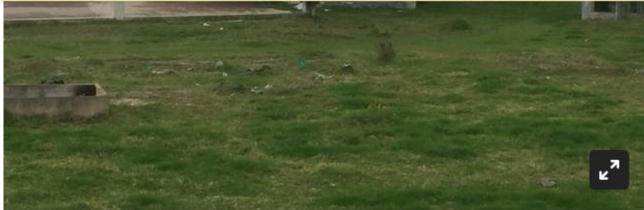
Elefante blanco: el centro de rehabilitación de la Policía que quedó en veremos en el kilómetro 20 de la Autopista Norte, en el sentido La Caro-Bogotá.

Investigan el asesinato de una pareja en Corinto, Cauca