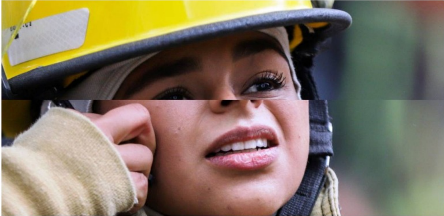
Encuentro de mujeres líderes del mundo empresarial colombiano en Cartagena

Encuentro de mujeres líderes del mundo empresarial colombiano en Cartagena